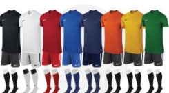
JOUEURS DE CHAMPS

Chaque couleur de pack est définie à l'avance par rapport à celle(s) renseignée(s) par votre club auprès de la FFF lors de son attribution de numéro d'affiliation.